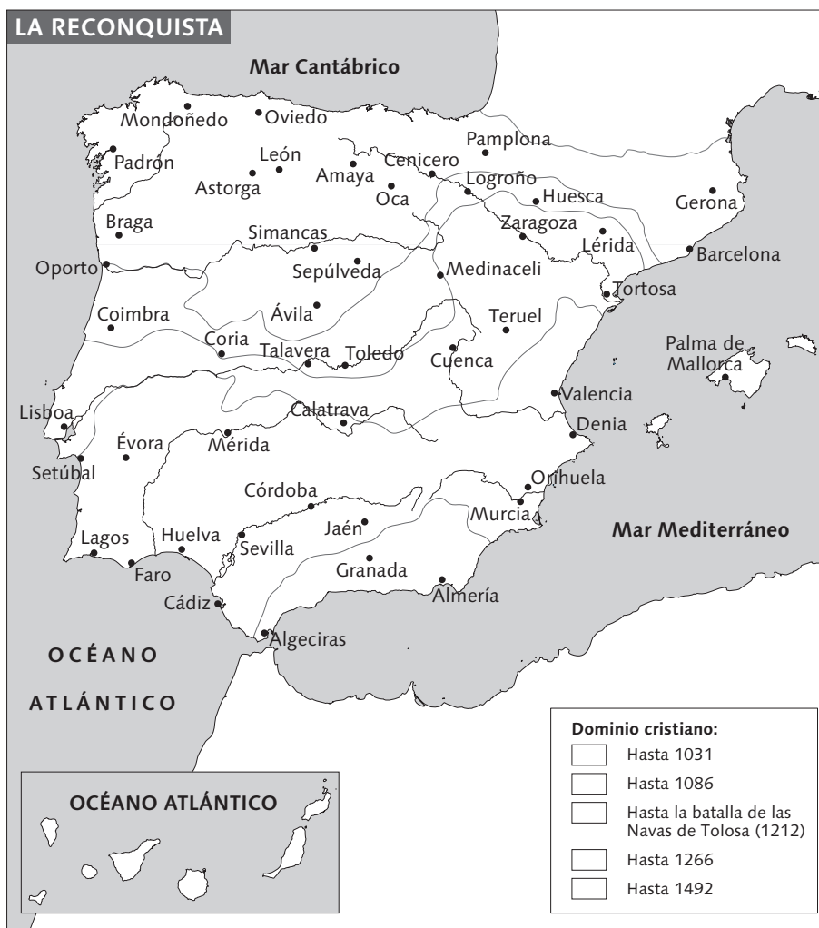
FUENTE: F. GARCÍA DE CORTÁZAR, Atlas de historia de España , Planeta (Adaptación).