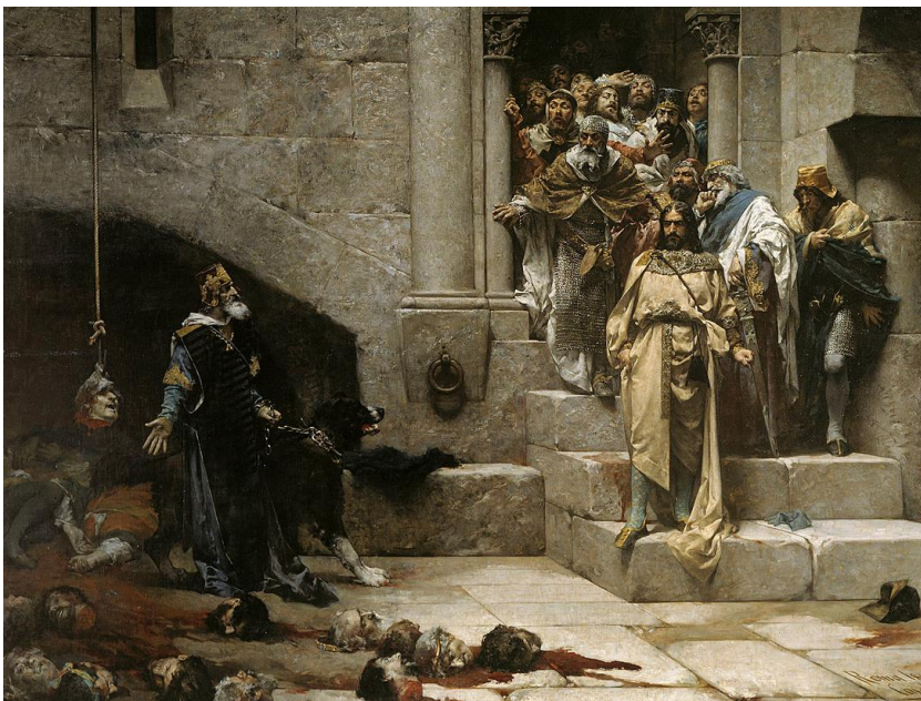
La campana de Huesca (José Casado)