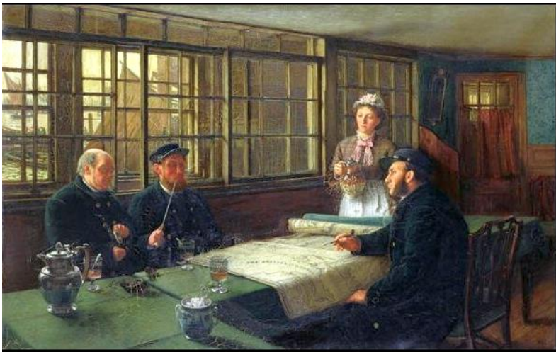
Discusión náutica, Charles Napier Hemy, 1877 (Newly). España[editar]