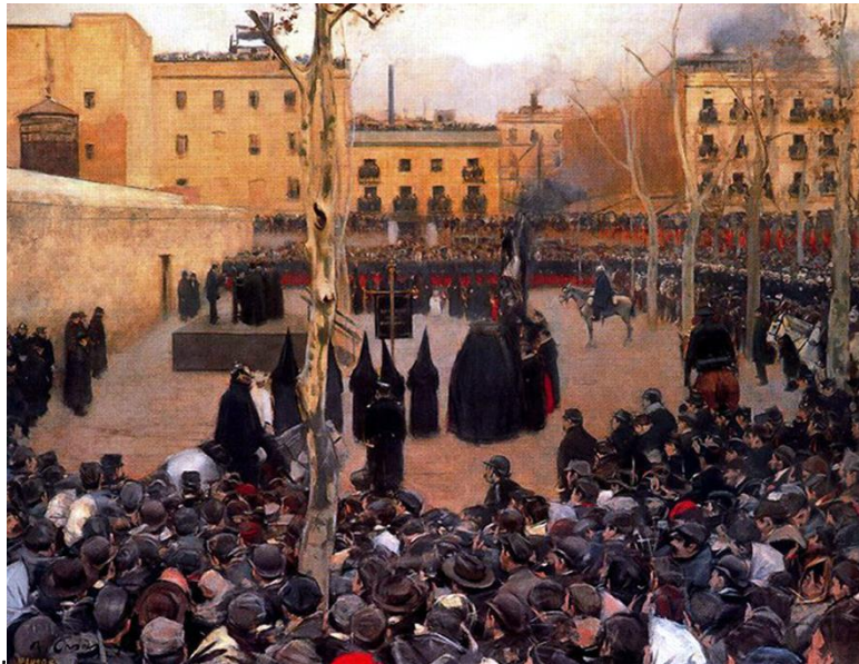
Garrote vil, de Casas,

El realismo se vinculó a las ideas socialistas más o menos definidas. Aunque con claras diferencias entre los distintos autores, en general se aprecia un interés por la situación de las clases más desfavorecidas de la sociedad surgida de la Revolución industrial. Algunos, adoptan una actitud absolutamente comprometida con los intereses del proletariado, participa en acontecimientos políticos del momento y hace un arte combativo. Otros, mantienen una postura más moderada, y endulzan de alguna forma su visión de la realidad.