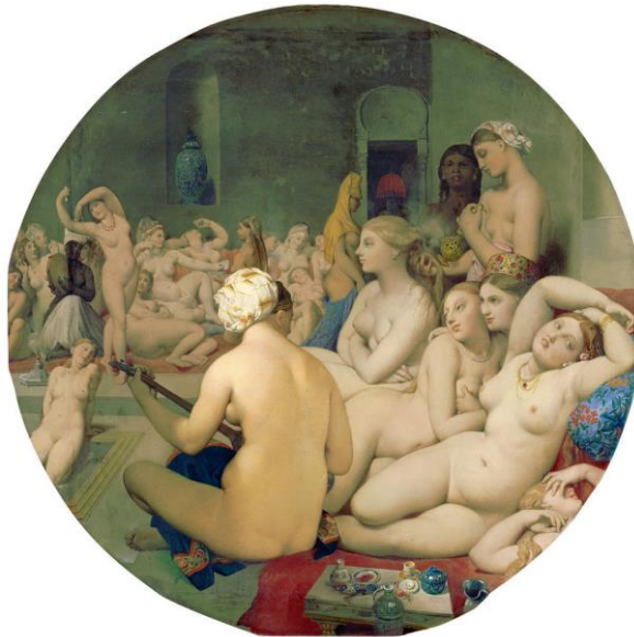
El baño turco, de Ingres,