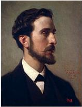
Retrato de Eduardo Rosales por Federico de Madrazo, 1867.