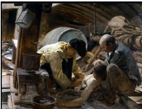
Aún dicen que el pescado el caro, Sorolla