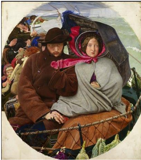
Última mirada a Inglaterra, de Ford Madox Brown