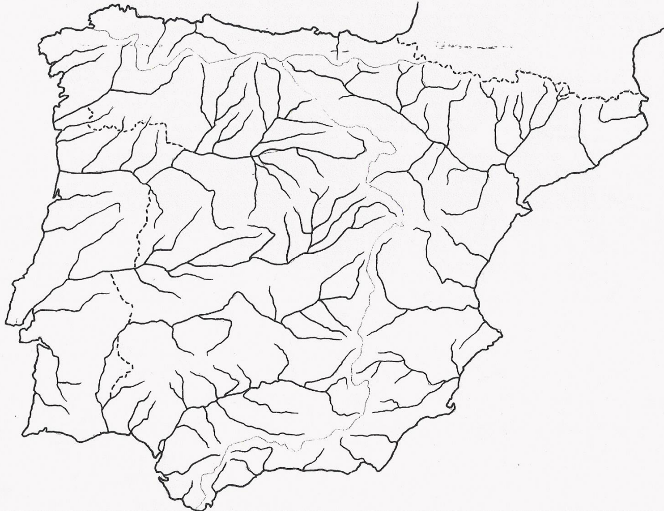
Mapa mudo para practicar