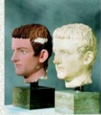
Policromía y monocromía