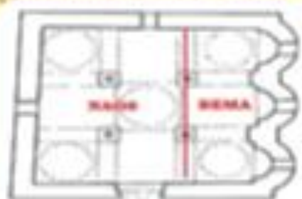
Planta de cruz inscrita basada en la cruz griega. Catedral de San Juan Bautista de San Juan (California, sur de San Francisco). Figura 10.7