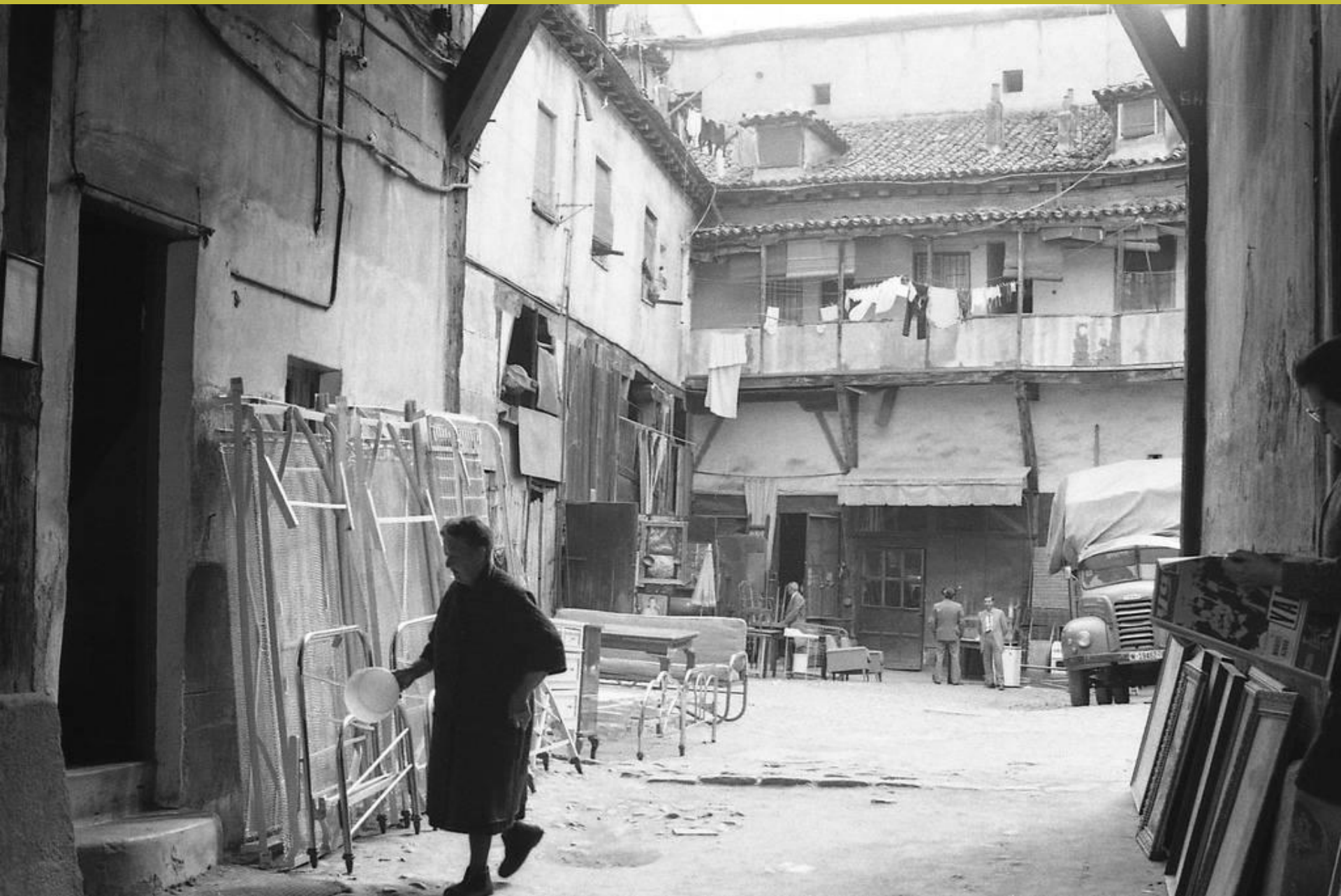
Corrala en el Rastro, foto de los años 70