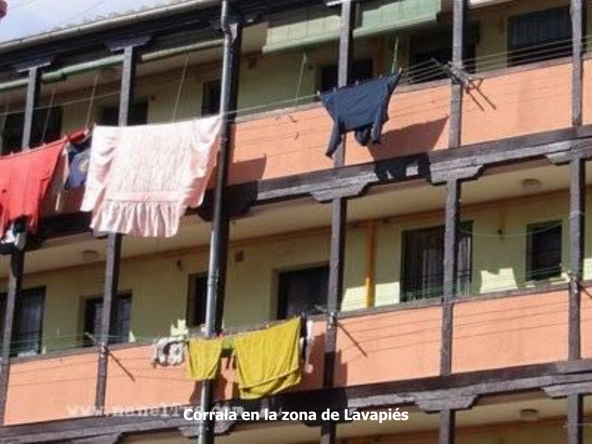
Corrala en la zona de Lavapiés