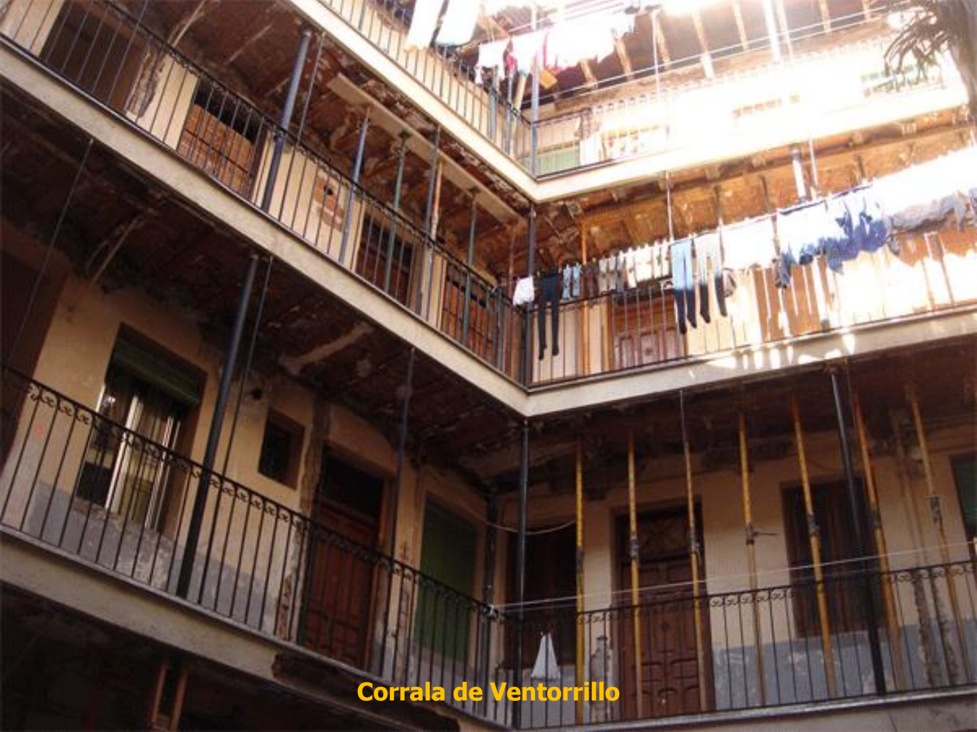
Corrala de Ventorrillo