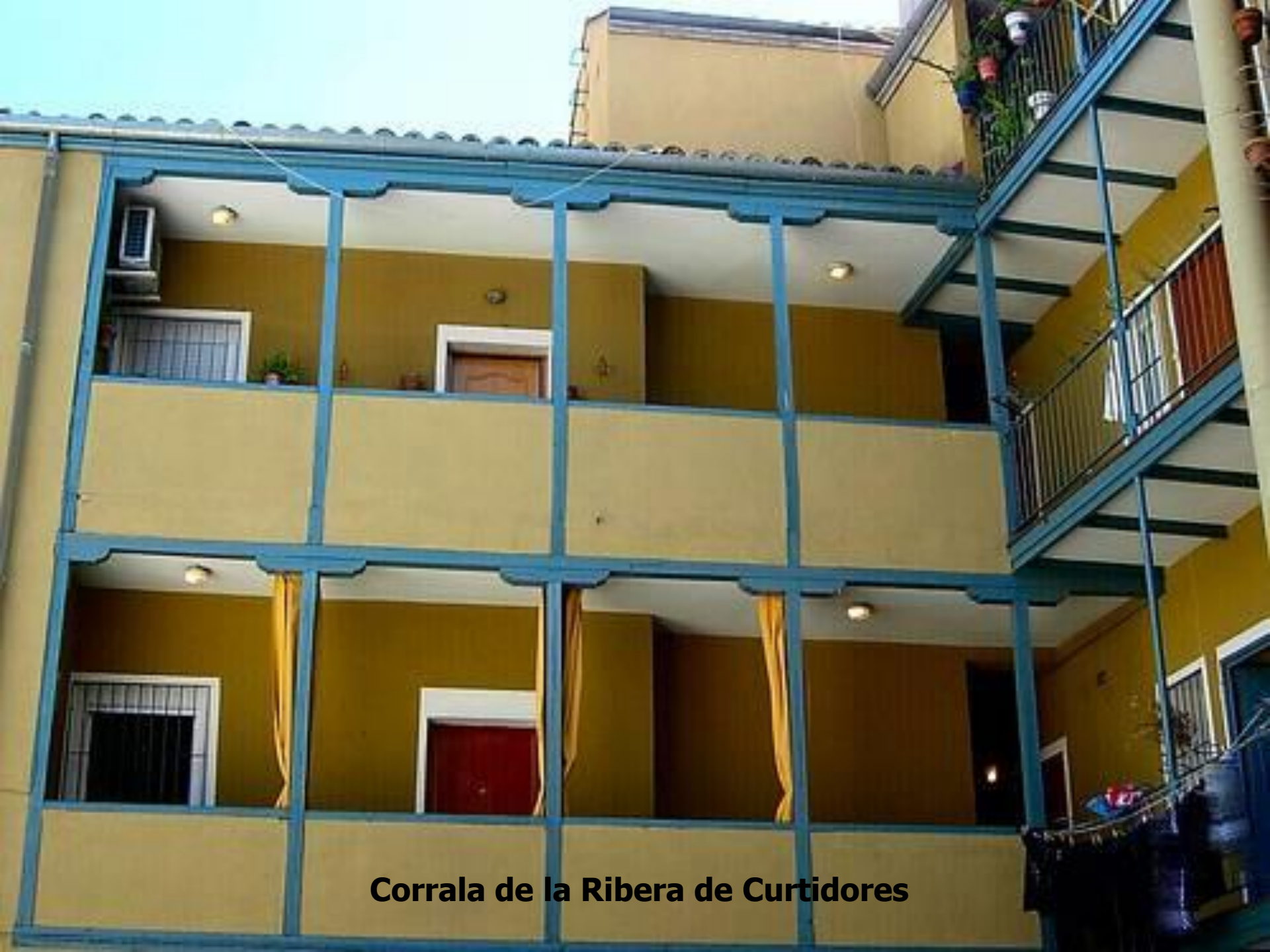
Corrala de la Ribera de Curtidores