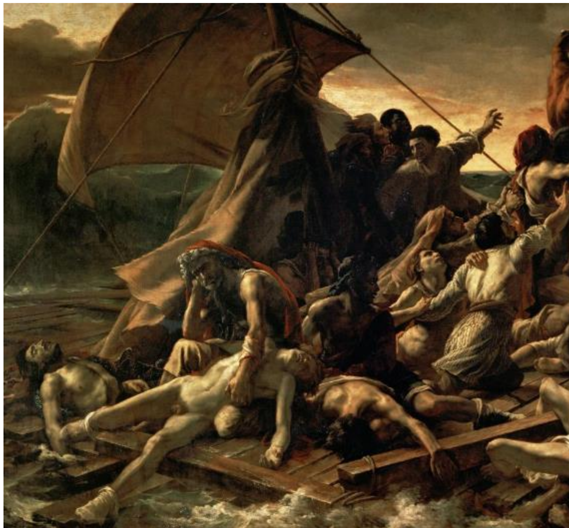
Gericault como uno de los muertos en la obra La Barca de Dante