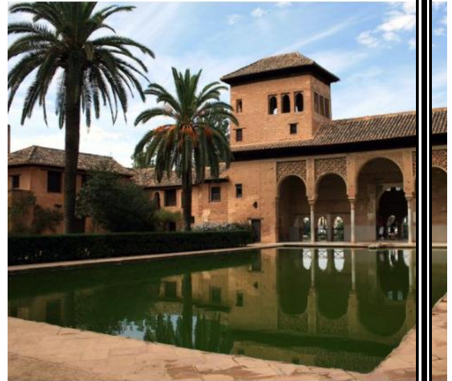
El partal, la Alhambra de Granada

la Alhambra consta del llamado Partal , el palacio más antiguo que era utilizado como palacio de recreo; y de un Baño Real al este del Palacio de Comares.