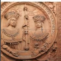
Reyes Católicos: Isabel y Fernando