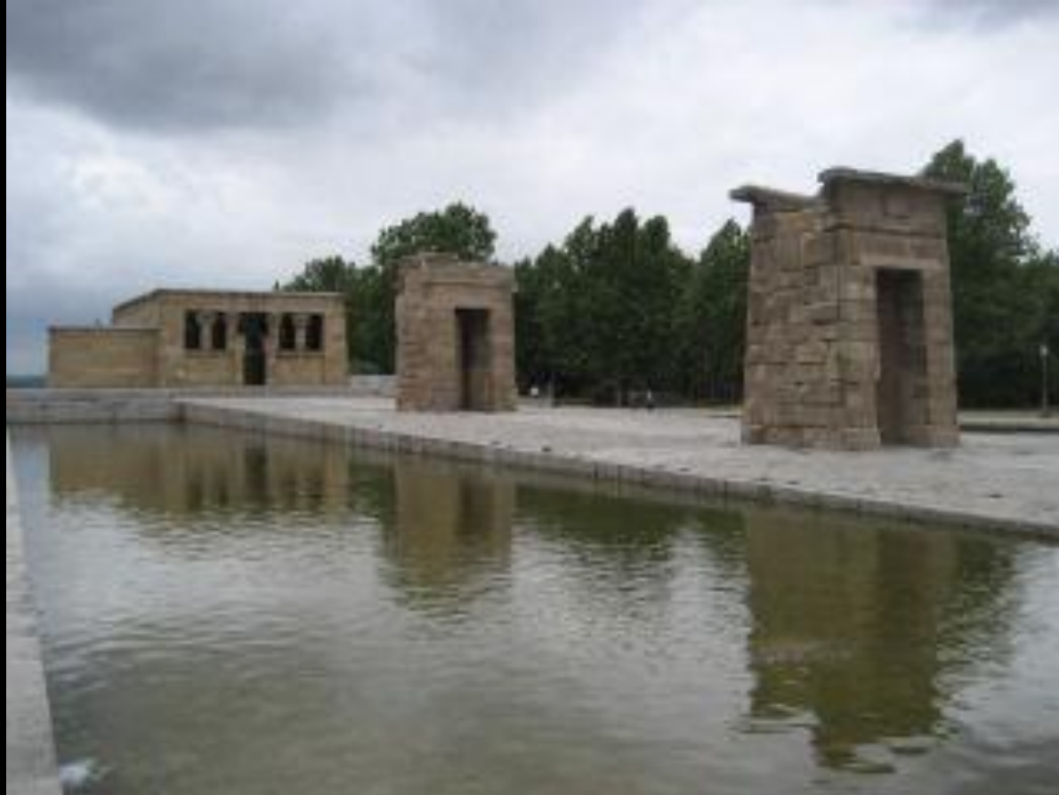
Templo de Debod