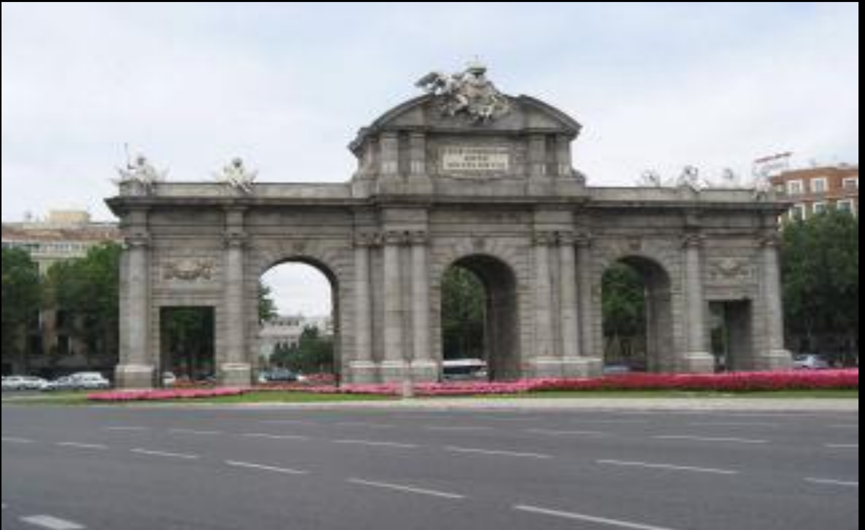
Fachada este de la Puerta