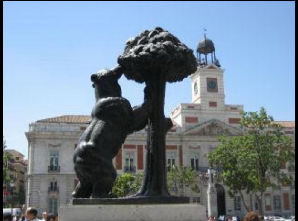
Escudo medieval y estatua actual en la Puerta del Sol