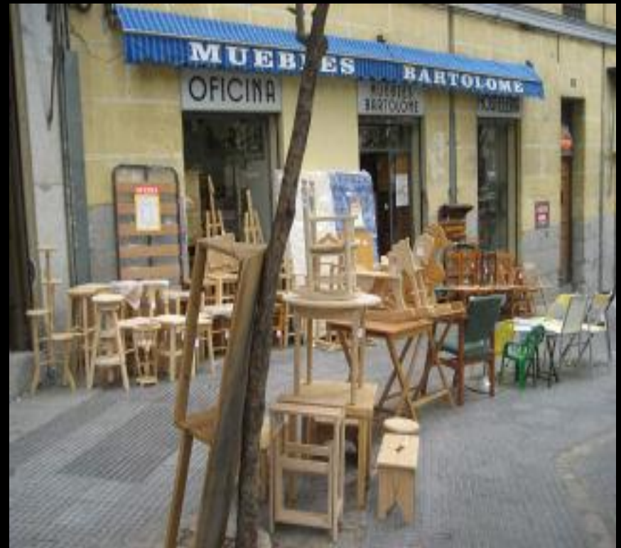
Venta de muebles en la acera