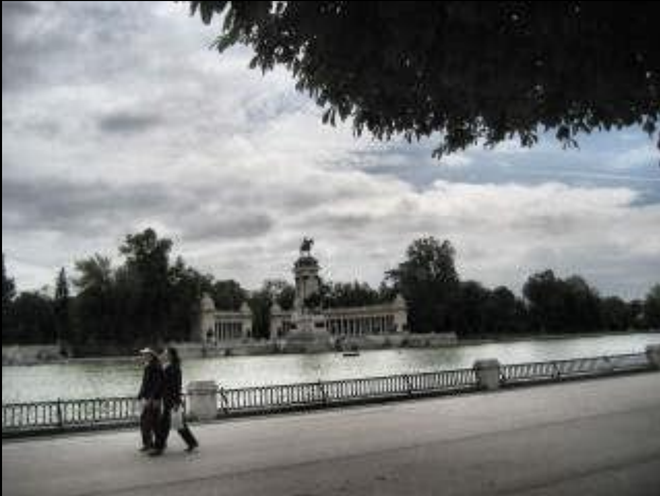
El estanque del Retiro, ante el monumento a Alfonso XII