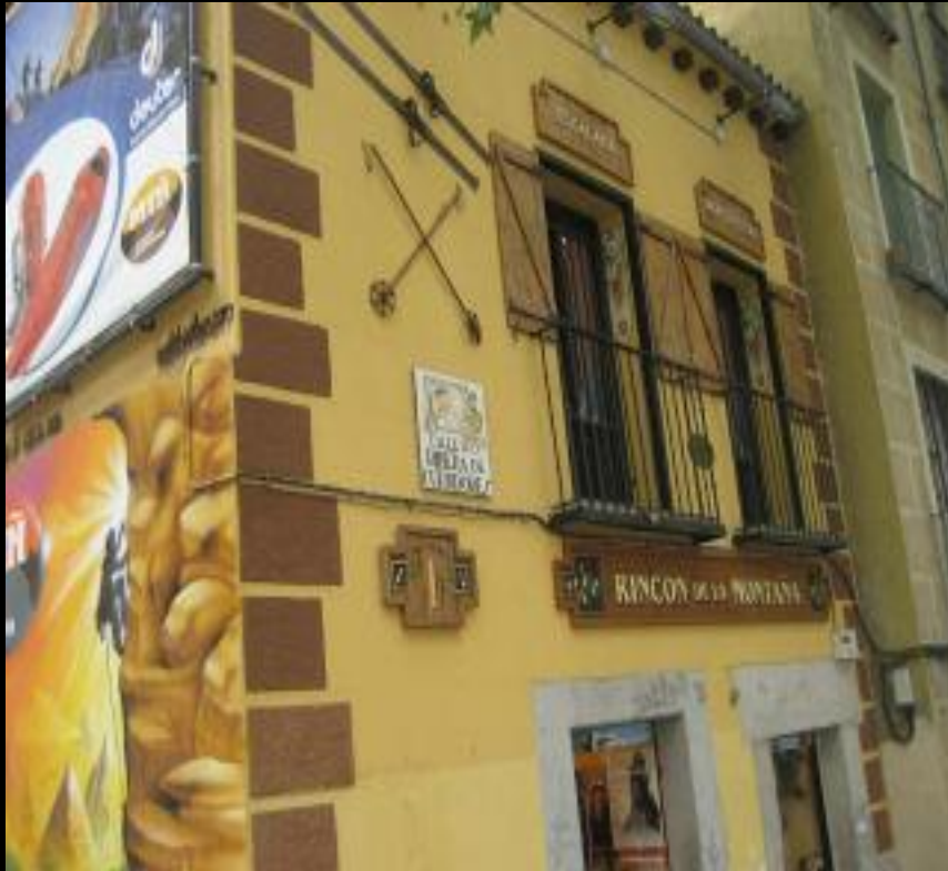
Nº 1 de la Ribera de Curtidores