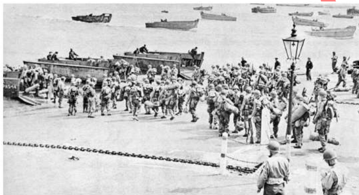
Preparativos para el desembarco de Normandía.