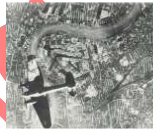
Bombardeo de Londres por la Luftwaffe alemana.

A fines de 1940, Alemania es dueña de buena parte de Europa, pero no ha conseguido derrotar a Inglaterra.