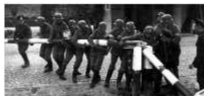
Tropas alemanas invaden Polonia (1-IX-1939) es el inicio de la guerra.

1939, Septiembre: los alemanes y rusos ocupan Polonia de acuerdo con el Pacto Germano-Soviético de No Agresión. Francia e Inglaterra permanecen inactivos y no atacan a Alemania, produciéndose seis meses en los que ningún enemigo ataca al otro.