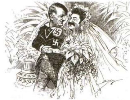
¿Hasta cuándo durará la luna de miel? Caricatura de la aproximación entre Hitler y Stalin.

Este pacto contra natura cogió de improviso a Francia e Inglaterra, cuando Hitler amenazó con ocupar el “Pasillo Polaco” en agosto de 1939, pues ambos pensaron que Alemania no se atrevería a desafiar a la URSS invadiendo Polonia. Por eso, dieron garantías a Polonia de que, si Alemania la invadía, ellos declararían la guerra a Alemania. De este modo, cuando Hitler invadió Polonia el 1 de septiembre de 1939, Inglaterra y Francia le declararon la guerra, mientras la URSS no sólo no atacaba a Alemania, sino que colaboraba con ella en la ocupación de Polonia.