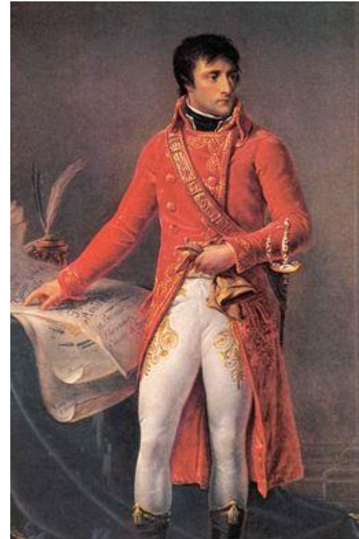
Napoleón como primer cónsul