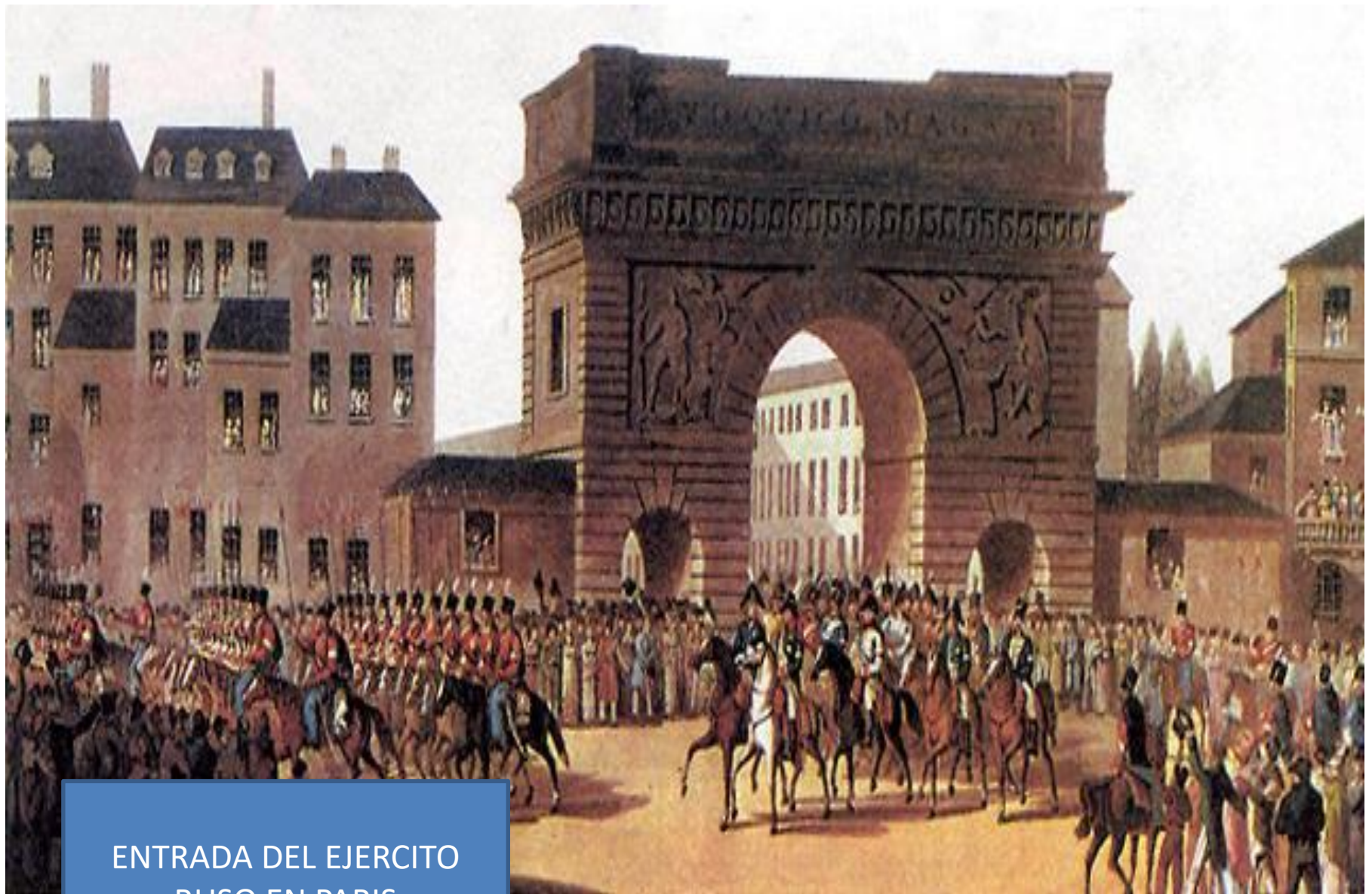
ENTRADA DEL EJERCITO RUSO EN PARIS