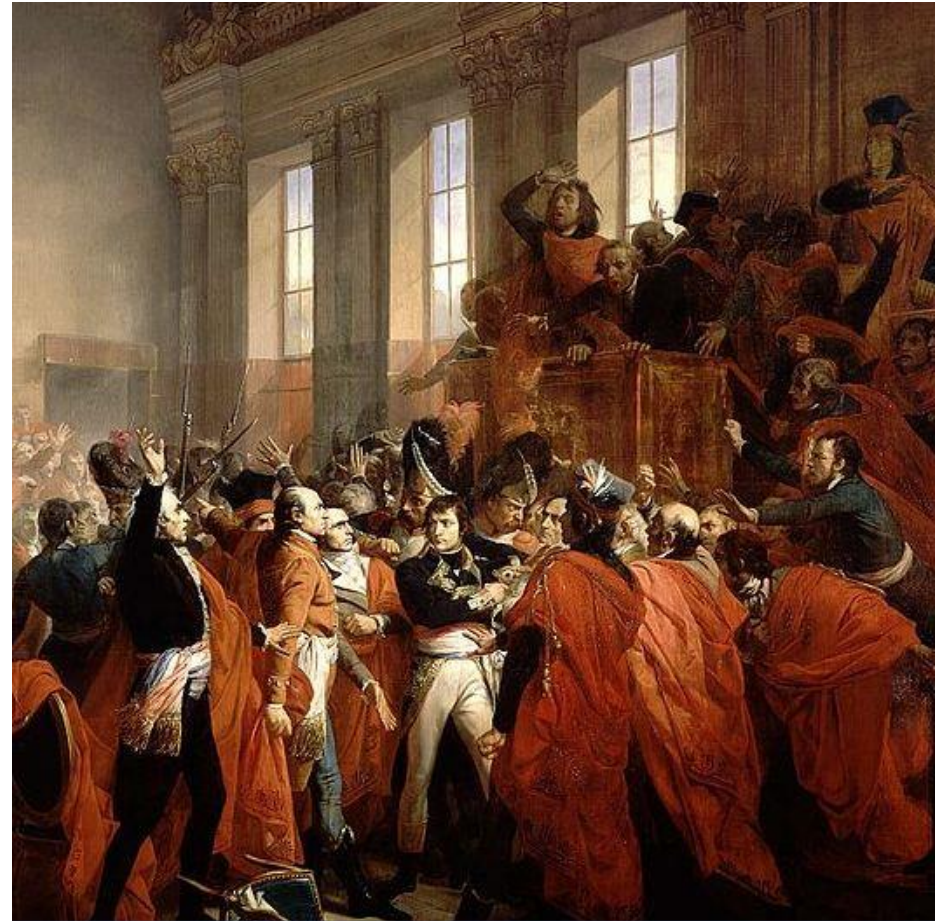
Abucheo el 18 de brumario