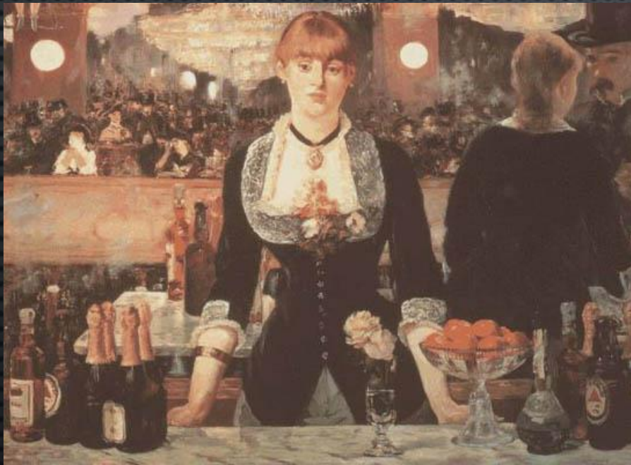
El bar de Folies-Bergère

VIAJÓ A ESPAÑA, LE IMPRESIONÓ SU FORMA DE VIDA, SUS COSTUMBRES, EL FOLCLORE, EL MUNDO DE TOREROS Y MANOLAS. AQUÍ, TUVO LA OPORTUNIDAD DE CONOCER EL ARTE DE PINTORES DE LA TALLA DE VELÁZQUEZ Y GOYA, AMBOS INFLUYEN EN SU OBRA