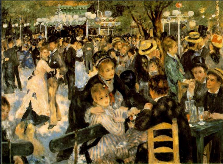
Le Moulin de la Galette

LOS TEMAS QUE CULTIVA: FLORES, ESCENAS DULCES DE NIÑOS Y MUJERES. EL DESNUDO FEMENINO