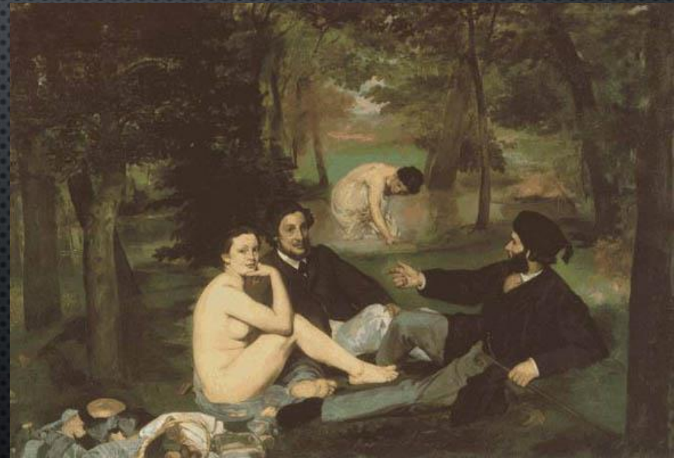
Desayuno sobre la hierba