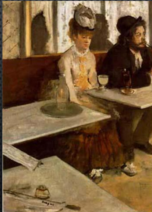
La bebedora de ajenjo